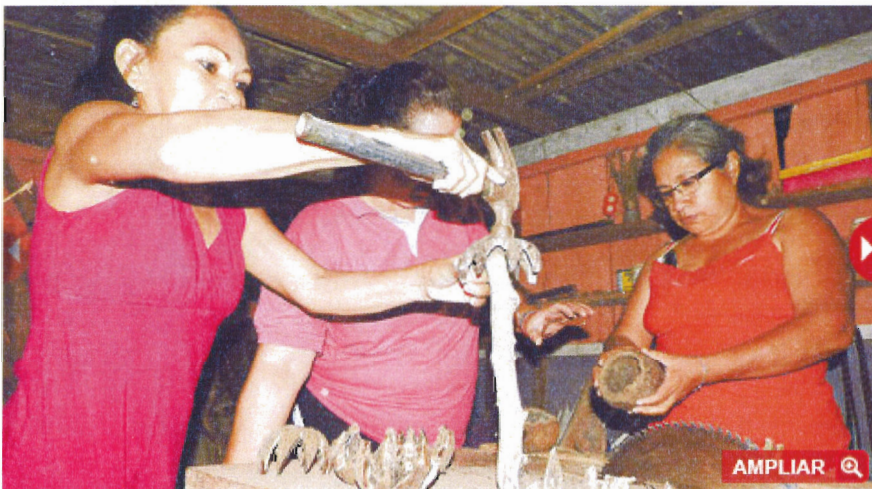
Mujeres de la comunidad de Buen Retiro

En el norte amazónico, emprendimientos liderados por mujeres permiten un nuevo ingreso económico para sus familias